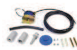
EF - 27 ** Elettrofreno per Serie 227

Codice articolo 401301 Prezzo (euro) 102,00