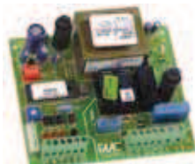
Scheda elettronica di comando 200 MPS Caratt. tecniche a pagina 168

Codice articolo 790852 Prezzo (euro) 66,00