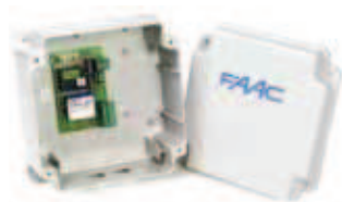
Scheda elettronica 200 BT Caratt. tecniche a pagina 167

Codice articolo 790852 Prezzo (euro) 66,00