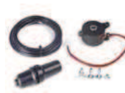
Elettrofreno R 180 - R 280 *

Codice articolo 720119 Prezzo (euro) 21,00