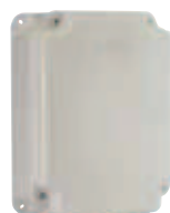
Contenitore mod. E per schede elettroniche

Codice articolo 790905 Prezzo (euro) 130,00