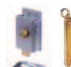
Accessori vari pagina 189