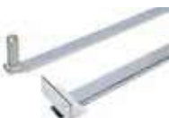
Braccio telescopico standard con accessori per l'installazione 738703