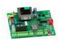
Scheda elettronica E045S Novità 790077