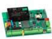
Scheda elettronica E145S Info a pag. 166 Novità 790076