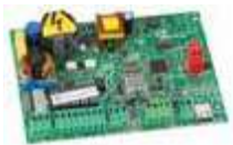
Scheda elettronica E045 Info a pag. 164 In esaurimento 790005