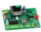
Scheda elettronica E045S Novità 790077